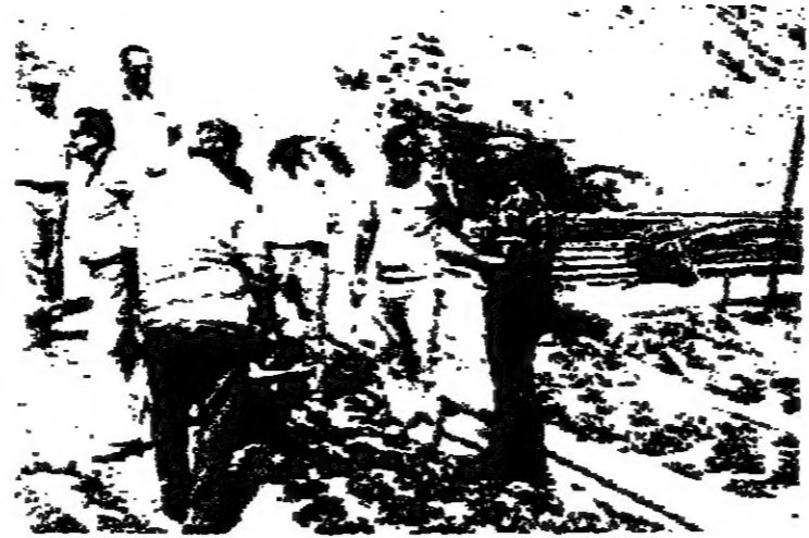
مدير شعبة الخضار مع المرشدين الإسرائيليون في مزارع غزة

ويجلب حوالى ٧٠٠٠ طن من البازيلاء من قطاع غزة وتصدر إلى أوروبا عن طريق محطة دير البلح.